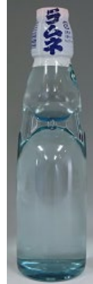
「びんラムネブレーン」 (宮城) 200ml

山のはちみつ屋さん（秋田県仙北市）の上質な国産トチはちみつを使用し、柔らかな甘みとすっきりの上品なサイダーに仕上がっております。