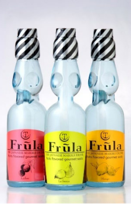
「フルーラ ラ・フランス/ライチ/マンゴー」 (佐賀) 200ml

インスタグラムでヒットした果実のフレーバーを使用し、ネーミング・パッケージともにお洒落仕に上げた炭酸飲料シリーズです。創業以来の商品でもあるラムネの容器を採用しつつ、デザイン性にもこだわり抜いた商品です。