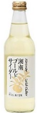
「湘南ゴールドサイダー」 (神奈川) 340ml

保存料、着色料を一切使わず厳選された国産温州みかん果汁10%のやさしいサイダー。温州みかんのみずみずしさを微炭酸に、和モダンなパッケージがひとときわ美味しさ、爽やかさを後押しします。