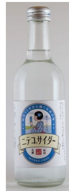
「 ニテコサイダー 」 (秋田) 300ml

ワインのまち北海道池田町が誇る看板銘柄「山(やま)幸(さち)」のブドウ果汁でつくられたサイダーです。山幸らしいほのかに酸味を感じるワインのような香り豊かなサイダーです。