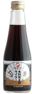
「 本別黒まめサイダー 」 (北海道) 240ml

国立公園に指定されている湖オンネトの青をイメージしてつくりました。まるで森林浴をしているような気分になれるサイダーです。北海道足寄町の山林に生えるアカエゾマツの葉のフレーバーがほんのりと香ります。