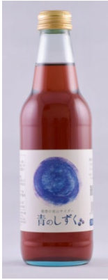
「能登の里山サイダー 青のしずく」 (石川) 340ml

北陸最大級のブルーベリーの産地・石川県能登町をイメージした地サイダーです。甘酸っぱく、すっきりとした飲み心地です。