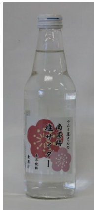
「南高梅塩サイダー」 (東京) 340ml

中野でおよそ80年以上ラムネを作り続けている「東京飲料」の職人達が心をこめて作ったサイダー、昭和の味です。