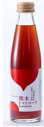
「熊本トマトコーラ」 (熊本) 200ml

お風呂あがりの至福のひとつに最高の「おいしさ」を、との思いから誕生したサイダーです。ミニボトルに「おいしさ」と「さわやかさ」をギュッと詰め込んだ、こだわりのサイダーです。