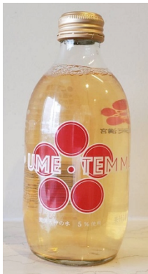
「UME・TEMMA」 (大阪) 300ml

濃縮還元みかん果汁を使った果汁飲料ではなく、和歌山県産のストレートみかん果汁50%使用し、みかんの風味を最大限生かしました。果汁と液糖、炭酸のみを使用したシンプルなサイダーでありながら、果汁を50%も使用した贅沢な商品です。