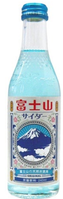
「富士山サイダー」 (静岡) 240ml

「カリーにあうジンジャーエール」として、本商品は新宿中村屋総料理長、二宮健氏監修のもと誕生したジンジャーエールです。ラベルは新宿の高層ビル群を描き、カリーを連想できるカラーを採用しております。