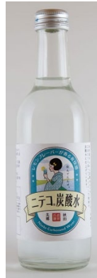
「ニテコ炭酸水」 (秋田) 300ml

ほのかに香るりんごの甘酸っぱさ風味がさわやかな炭酸と重なって、とってもフルーティーなサイダーに仕上がっています。