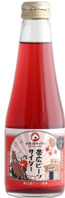
「 帯広ビーツサイダー 」 (北海道) 240ml

すももの里・北海道更別村には、約800本のすももの木があります。のどかな農村風景の中で育まれた甘酸っぱい果汁が、スッキリさわやかなのみちです。ピンを開けた時に広がる、すももの香りも一緒にぜひ楽しんでください。