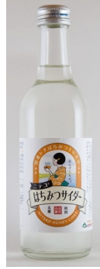
「はちみつサイダー」 (秋田) 300ml

爽快感溢れる炭酸水にレモンフレーバーを加えて、口当たりの良いスッキリとした後味の炭酸水に仕上がっています。