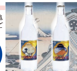
北斎ラベル（浪裏、赤富士）