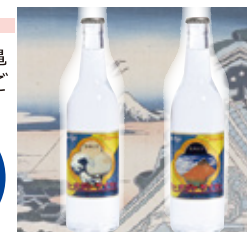
北斎ラベル（浪裏、赤富士）