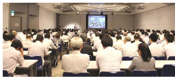
専門セミナーのもよう