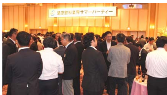
サマーパーティーのもよう