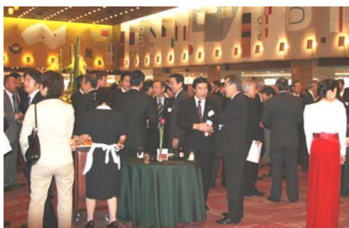
賀詞交歓会のもよう

年1回（7月）開催しています。清涼飲料の最盛期である夏の商戦の盛会を期して、会員や賛助会員等から600人ほどの参加をいただき業界の交流を進めています。参加者名簿も配布しています。参加は有償で1名につき参加費11,000円を頂戴しています。